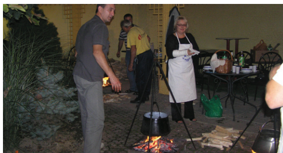
U ostatku Hrvatske prepoznaju nas po fiš-paprikašu

povratak gradskog duha, i to po uzoru na Varaždin s njegovim špencir-festom.